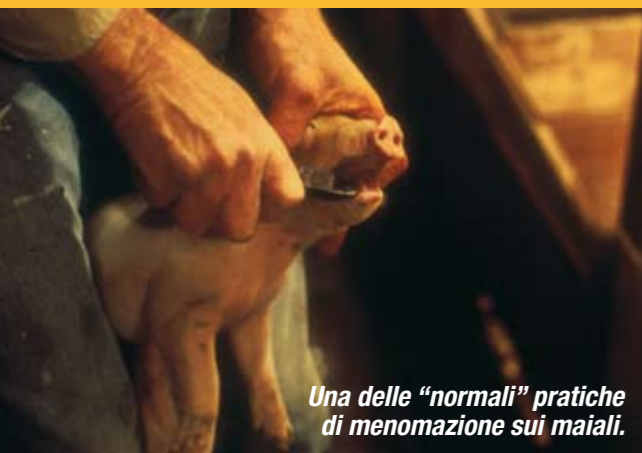
Una delle "normali" pratiche di menomazione sui maiali.