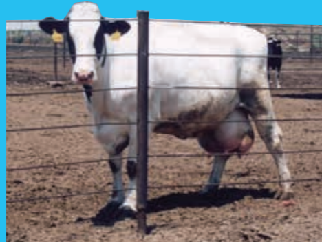
Una mucca da latte con le mammelle gonfie e doloranti

Le mucche "da latte", all'età di circa due anni partoriscono il primo vitello, iniziando così la produzione di latte: senza partorire non producono latte, come tutti i mammiferi, umani compresi. Dopo circa un anno devono partorire un altro vitello, per continuare a produrre latte ininterrottamente. Poco dopo la nascita, i vitelli sono strappati alle madri, perché non ne bevano il latte, e tenuti in piccolissimi recinti, in cui non hanno nemmeno lo spazio per muoversi. Sono alimentati con una dieta inadeguata, per renderli anemici e far sì che la loro carne sia bianca e tenera (come piace ai consumatori) e dopo 6 mesi sono mandati al macello. La mucca viene munta meccanicamente e costretta a produrre una quantità di latte pari a 10 volte quello