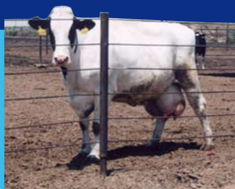
Una mucca da latte con le mammelle gonfie e doloranti

Le mucche "da latte", all'età di circa due anni partoriscono il primo vitello, iniziando così la produzione di latte: senza partorire non producono latte, come tutti i mammiferi, umani compresi. Dopo circa un anno devono partorire un altro vitello, per continuare a produrre latte ininterrottamente. Poco dopo la nascita, i vitelli sono strappati alle madri, perché non ne bevano il latte, e tenuti in piccolissimi recinti, in cui non hanno nemmeno lo spazio per muoversi. Sono alimentati con una dieta inadeguata, per renderli anemici e far sì che la loro carne sia bianca e tenera (come piace ai consumatori) e dopo 6 mesi sono mandati al macello. La mucca viene