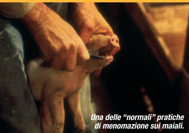
Una delle "normali" pratiche di menomazione sui maiali.