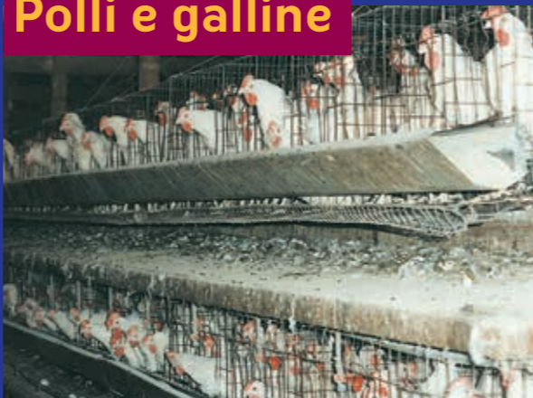
Le galline nelle gabbie piccolissime e affollate perdono molte delle loro piume.

"da carne" sono allevati in capannoni affollatissimi, fino a 10-15 polli per metro quadrato, sotto la luce sempre accesa, perché crescano in fretta. A 45 giorni vengono ammazzati, mentre in natura potrebbero vivere fino a 7 anni.