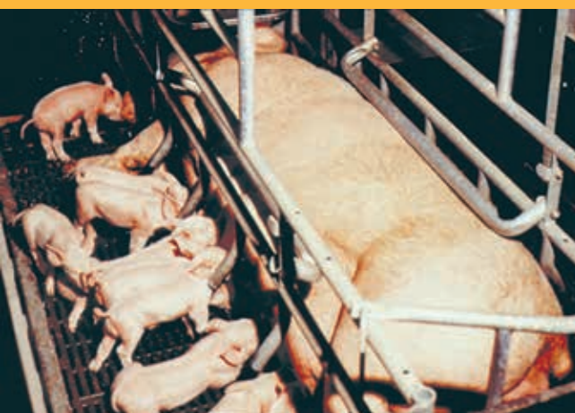
Sbarre di ferro separano i piccoli della loro madre.