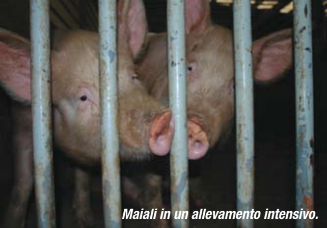
Maiali in un allevamento intensivo.