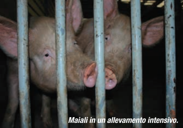
Maiali in un allevamento intensivo.