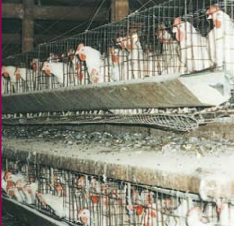
Le galline nelle gabbie piccolissime e affollate perdono molte delle loro piume.

polli per metro quadrato, sotto la luce sempre accesa, perché crescano in fretta. A 45 giorni vengono ammazzati, mentre in natura potrebbero vivere fino a 7 anni.