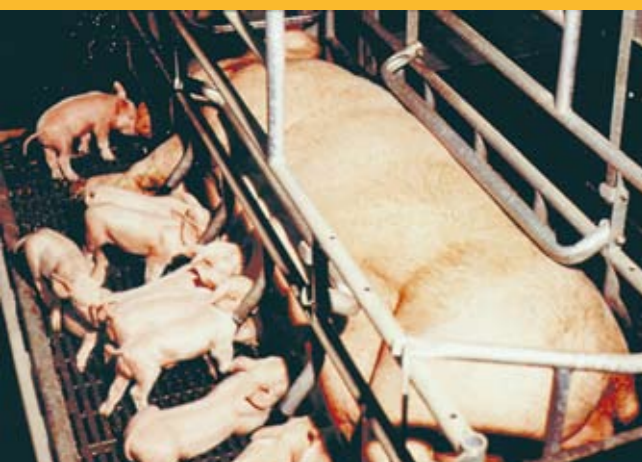
Sbarre di ferro separano i piccoli della loro madre.